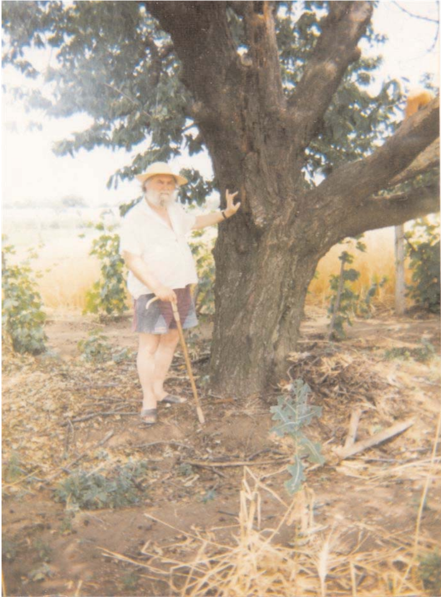
Heves, Cs.Sz.B. és a vén cseresznyefa 1994 nyár